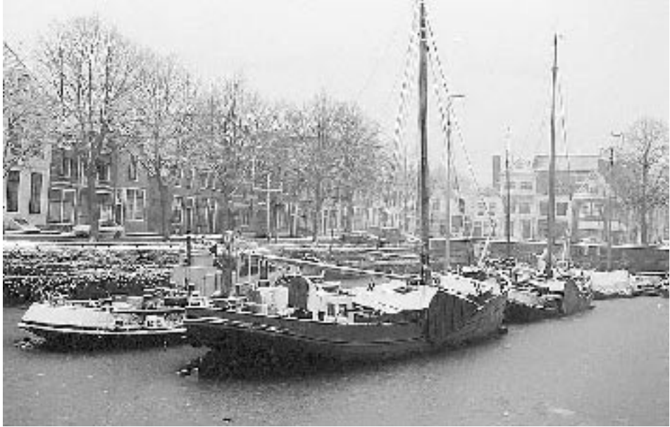
Wintergezicht op de Museumhaven