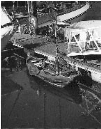
De 'Hollandse' boot 'De Groene Welp' was geschikt voor ruw water