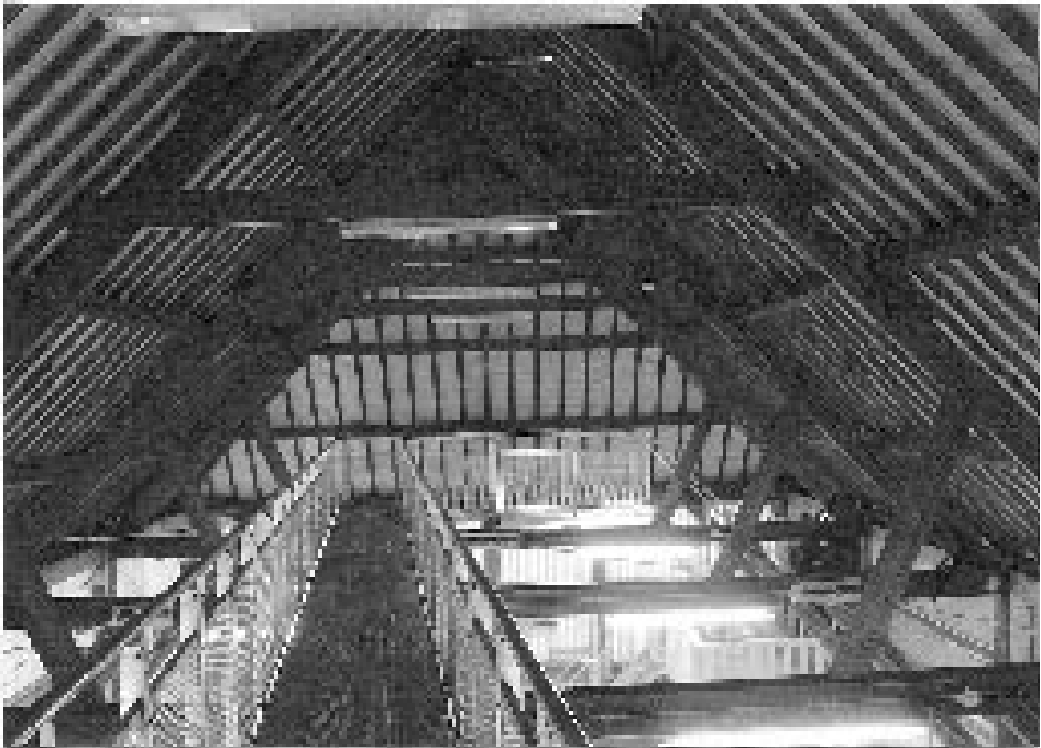
Vanaf de luchtbrug in de restauratiewerf heeft het publiek een goed uitzicht op de restauratiewerkzaamheden. Voor deze brug werd de Bouwfonds Award voor Vitale Monumenten 2005 toegekend.

In oktober 2003 vangen de restauratiewerkzaamheden aan de houtloods aan. De officiële oplevering is op de Open Monumentendag in september 2004. De Stichting Museumhaven Zeeland doopt de nieuwe scheepsrestauratie- en reparatiewerkplaats 'Stads- en Commercieerf', een verwijzing naar de maritieme historie van Zierikzee. In het gebouw is een loopbrug aangebracht, zodat bezoekers