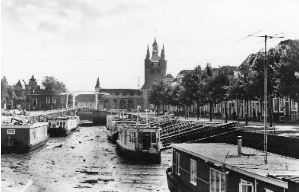
Woonarken in een drooggevalle Oude Haven bij eb, jaren 70, 20 ste eeuw.