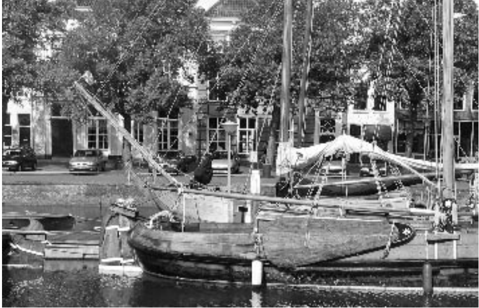
Boeier 'De Vabel' was vroeger in dienst van de Ambulante Recherche (douane)

Inspeland op het nieuw toeristisch-recreatief beleid van de provincie, dat meer accent legt op cultuurhistorische elementen, laat de stichting medio 1995 een haalbaarheidsanalyse maken voor de ontwikkeling van een Zeeuws kustvisserij-, binnen- en beurtvaartmuseum in Zierikzee annex scheepsreparatie- en restauratiewerkplaats. De historische binnenstad en de havens van Zierikzee vormen een grote trekpleister voor toeristische bezoekers. Een museumhaven is ook bevorderlijk voor de plaatselijke horeca en detailhandel. De werf kan vlakbij de Oude Haven aan de Vissersdijk worden geprojecteerd.