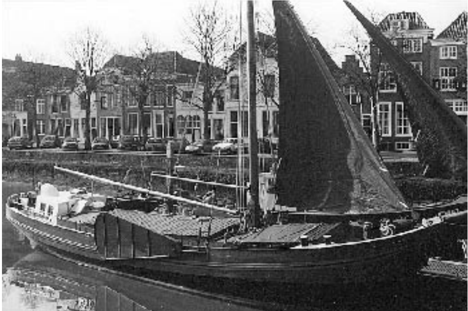
Rivierklipper 'Mijn Genoegen' was het eerste schip dat de Museumhaven verwerf

Maar de haven is nog steeds leeg. Het 'Zeeuws schip' en de klipper komen niet naar Zierikzee. De stichting biedt de Stichting Behoud Hoogaars in september 1990 ligplaatsen in de haven aan. De Stichting Behoud Hoogaars voelt daar wel voor, mits zij wordt vrijgesteld van liggeld, zoals ook in Vlissingen. Omdat de gemeenteraad zich op dat moment nog niet heeft uitgesproken over de investeringsplannen voor de Oude Haven, staat het college van B&W de Museumhaven niet toe om bindende afspraken te maken met de Stichting Behoud Hoogaars, die daarop haar banden met de provincie verder aanhaalt. Er komen definitief geen schepen van de Stichting Behoud Hoogaars in de Oude Haven. De haven zou ligplaats kunnen bieden aan passanten, maar voor passanten is een getijdhaven minder aantrekkelijk. Daar komt nog bij dat zij eerst twee bruggen moeten passeren (bruggeld!). Zij verkiezen de Nieuwe Haven. Niettemin kan Zierikzee eerstdaags een eerste schip begroeten, de klipper, met recht genaamd 'Mijn Genoegen'. Het Zuiderzeemuseum was bereid om de eerder aan de provincie aangeboden klipper in bruikleen af te staan. De klipper is van origine een zeilschip en in de loop der tijden verbouwd tot motorschip. Het schip ligt dan wel in de museumhaven, maar moet gerestaureerd worden. Technisch, organisatorisch en financieel een uitdaging. Provinciale subsidiestromen plegen niet dan met grote moeite af te buigen naar Schouwen-Duiveland. De 'Slavenkas' legt