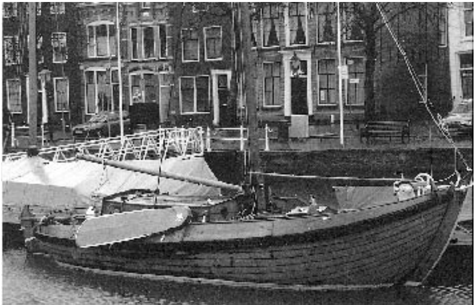
Botter 'De Meeuw', een ondiep schip, werd gebruikt door de visserij-politie