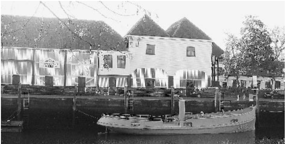
De voormalige veerboot de 'Zuidvliet' wordt gerestaureerd, en ligt voor de scheepsrestauratiewerf

Het project krijgt de naam 'Museumhaven Plus' en getuigt van visie. Om de investeringskosten van het 'Museumhaven Plus' - project te drukken, zoekt de gemeente in de herfst van 1997 grensoverschrijdende samenwerking binnen de Euregio Scheldemond met het Scheepvaartmuseum in Baasrode (België), waardoor Europese subsidie (Interreg II) binnen bereik komt. De museumhaven komt in ander vaarwater. De exploitatiekosten van de museumhaven, waaronder begrepen het jaarlijkse tekort op het onderhoud van de schepen, zijn ondergebracht in de exploitatiekosten van het totale 'Museumhaven Plus'- project. Zolang het project nog niet is gerealiseerd, subsidieert de gemeente het tekort.