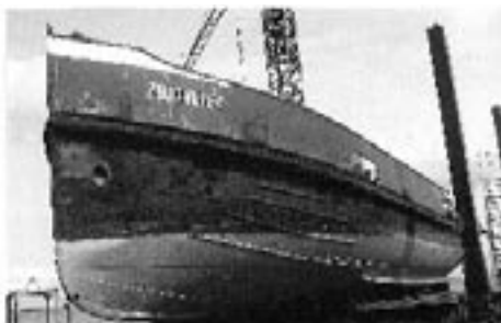
De 'Zuidiliet' wordt deels gerestaureerd aan wal, augustus 2004