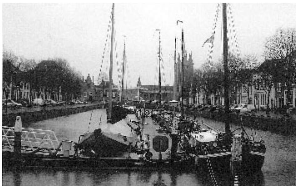
Overzichtsfoto Museumhaven Zeeland

object in Zierikzee wordt vaker gefotografeerd dan de museumhaven, een toeristische trekpleister van formaat.