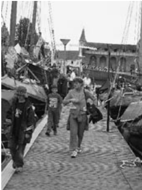
De collectie van de Museumhaven is een trekpleister voor toeristen